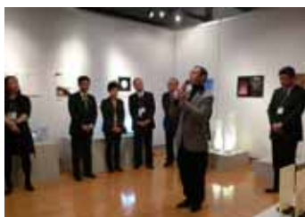
来賓 / 中部デザイン協議会 会長