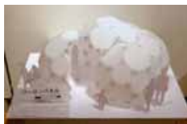
優秀賞 / ワーロンパネル 中部大学大学院 保浦 隆宏さん